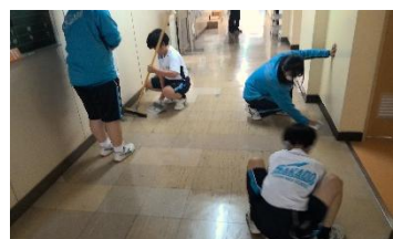
《人と離れて静かに自分の清掃を》

そうすることで、教育目標の「自立のための自律」である自分で自分の生活をコントロールする力「坂中スピリット」を身につけた生徒に《自分の分担が終わったら気付いた清掃を》なってほしいのです。