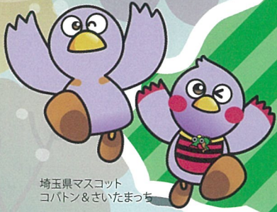
埼玉県マスコット コバトン&ざいたまっち