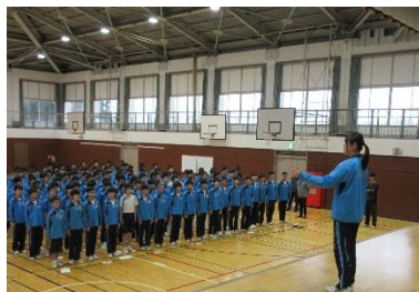
《2,3年生で国歌、校歌の練習をして》