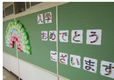
《新入生を迎える飾りつけ》