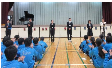
《準備登校で新しい先生を紹介》

「自立へ向けた自律ができる生徒」、「笑顔が輝く居心地のいい学校」を目指して職員一同今年度も「坂中スピリットの育成」を進めていきます。今年度もどうぞよろしくお願いいたします。