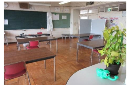
《学習支援室は静かに学習できます》