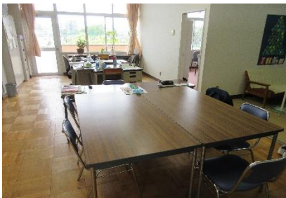
《明るく穏やかな雰囲気相談室》

相談室直通電話 289-8123。学習支援室に関するお問い合わせは 283-0219 坂戸中学校 教頭まで。