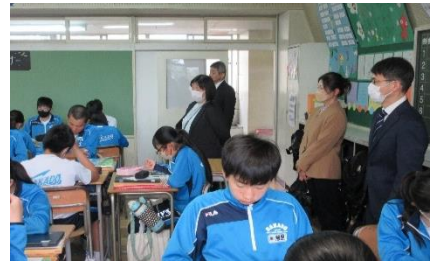
《委員の方々の授業参観》

また、生徒の様子、学校の決まり、授業のスタイルなど、様々な内容を協議いただきました。今年度も坂戸中の心強いパートナーとして「居心地のいい学校」づくりにご協力よろしくお願いたします。